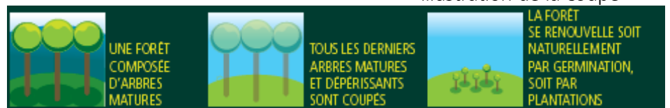
Illustration de la coupe

Une coupe de régénération appelée coupe rase est programmée sur 2.56 hectares sur la parcelle 36b et 1.05 sur la parcelle 49a. Cette opération sylvicole consiste à couper tous les derniers arbres arrivés à maturité. Le renouvellement de la forêt sera assuré grâce à une plantation.